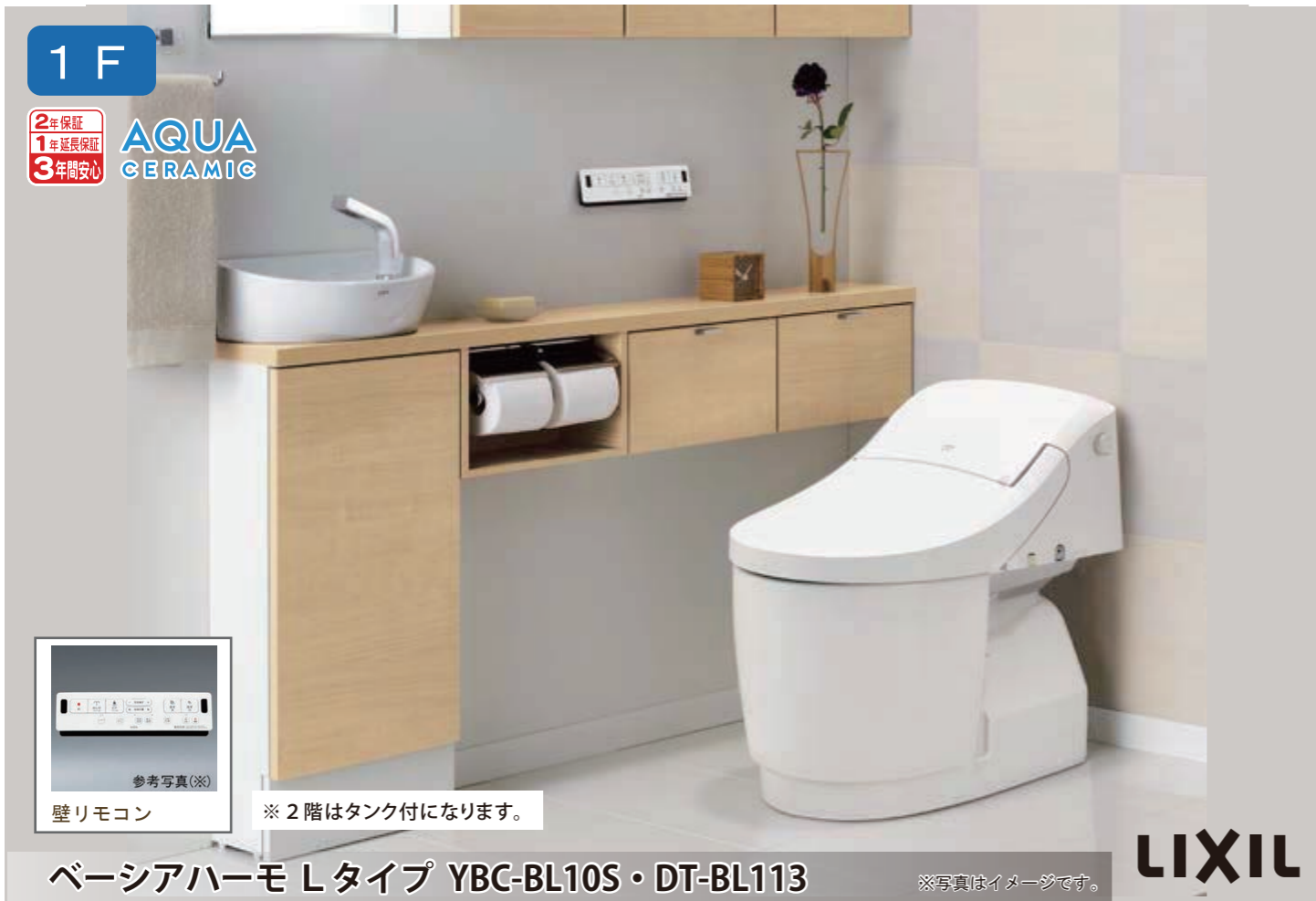
ベーシアハーモ Lタイプ YBC-BL10S・DT-BL113